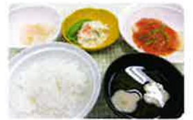
エネルギーコントロール食

永仁会病院では献立作成から調理まで当院のスタッフが行っていきます。患者様一人ひとりの病態や摂食嚥下機能に合わせた、きめ細やかな対応を心がけています。