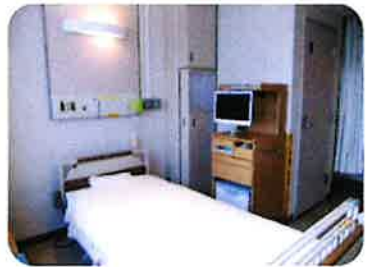
清潔感のある病室。個室も充実しています。