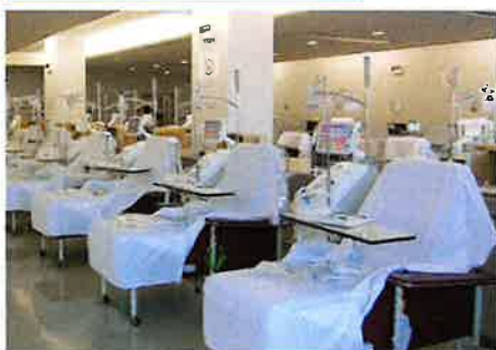
明るい南向きの透析室です

当院透析室は50床のベット数を有し、専門医、看護師、臨床工学技士、管理栄養士がチームとなって、安全で安心な透析医療を提供できるよう努めています。また、お仕事をされている患者様を対象に、火曜日・木曜日・土曜日には夜間透析を実施しています。