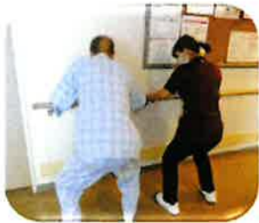
入院中でも筋力を維持できるよう運動を行います。