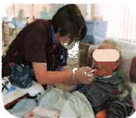
舌のトレーニングをして食べる機能を医師します。