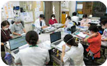
患者さまを多職種でサポートします。

当院は東北で始めてNST（栄養サポートチーム）を取り入れた病院です。NSTとは、患者様に最良の栄養療法を提供するために、医師、看護師、薬剤師、管理栄養士、臨床検査技師、理学療法士、言語聴覚士、歯科医師、歯科衛生士などで構成された医療チームのことです。患者様の栄養状態を評価し、適切な栄養療法を提案、実施をしています。患者様の治療効果の向上、合併症の予防、早期快復をめざしチームで取り組んでいます。